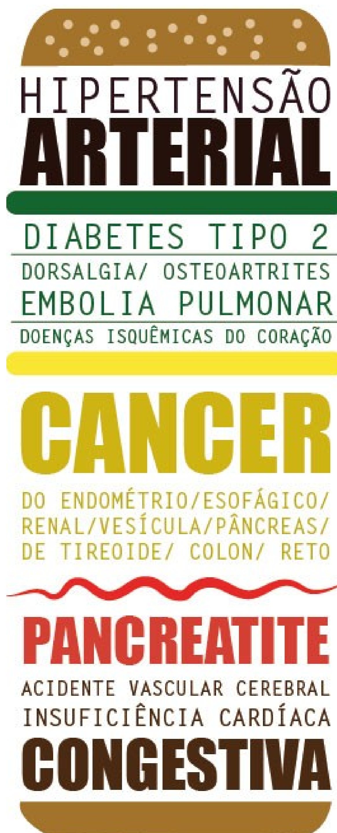
FIGURA 2 - DOENÇAS CAUSADAS PELA OBESIDADE.